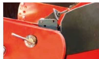
Model TANDEM-3000 s kovovými vyrovnávacími kolečky (volitelné)

Automatická spojka umožňuje rychlé a snadné připojení a rozpojení.