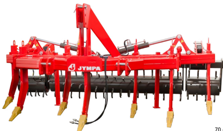
Model RIGEL-7-2V-550-PL s ocelovými botami a dvojitým válcem \varnothing 580 mm