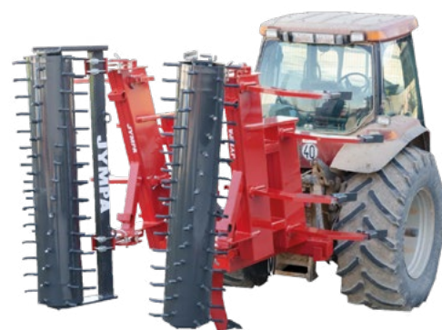
Model RIGEL-9-2V-PC s jednoduchým válcem Ø 580 mm

Modely s hydraulickým sklápěním také obsahují jednocestné ventily s regulátory průtoku a bezpečnostním systémem proti sklopení .