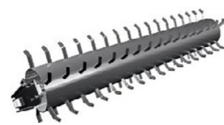
Jednoduchý válec Ø 580 mm