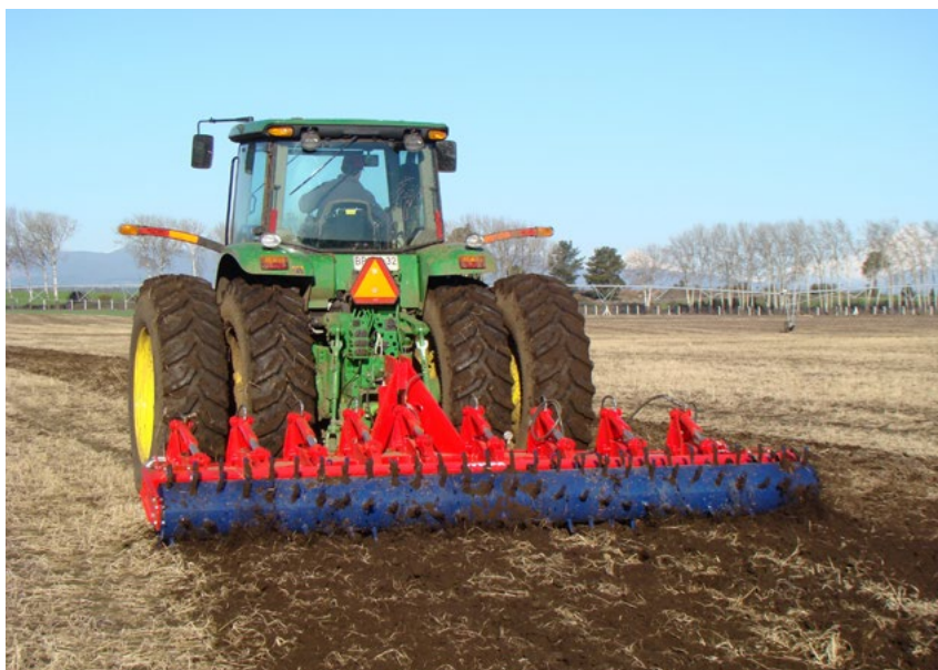
Model SPICA-7 s dvojitým válcem Ø 580 mm

Modely s hydraulickým sklápěním také obsahují jednocestné ventily s regulátory průtoku a bezpečnostním systémem proti sklopení .