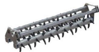
Dvojitý válec Ø 520 mm