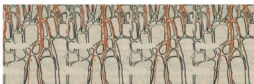
Po sklizni za sebou kořeny zanechají přirozené mini-kanálky