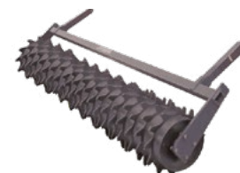
Pýchovací roller Ø 430 mm