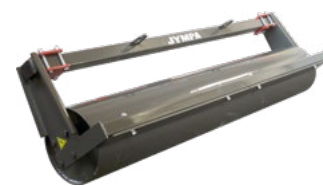
Uhlazovací roller Ø 325 mm